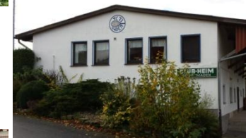
Vereinsheim TC 77 Maden